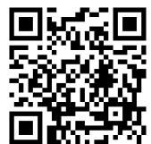
研修会 申込フォーム